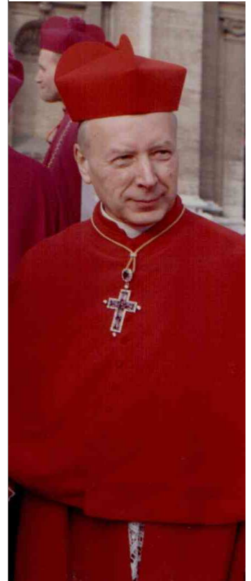
Ksiądz Kardynał Stefan Wyszyński Prymas Polski 1948-81 Arcybiskup Metropolita Gnieźnieński i War- szawski (1948-81)

Przyrzekamy uczynić wszystko, co leży w naszej mocy, aby Polska była rzeczywistym królestwem Twoim i Twojego Syna, poddanym całkowicie pod Twoje