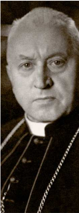
Ksiądz Kardynał August Hlond Prymas Polski 1926-48 Arcybiskup Metropolita Gnieźnieński (1926-48), Poznański (1926-46) i Warszawski (1946-48)